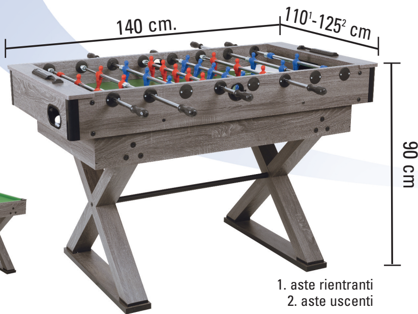
1. aste rientranti 2. aste uscenti