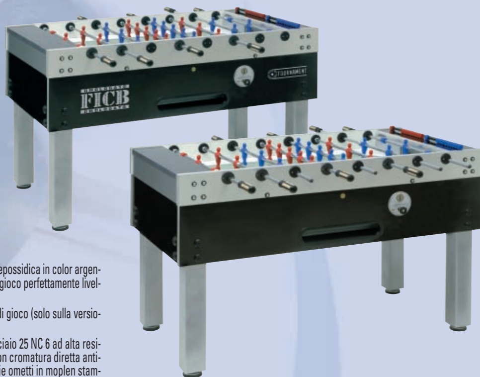
TABELLA TECNICA • TECHNICAL CHART • TECHNISCHE TABELLE

15 In dotazione 10 palline gialle (calciobalilla omologata FICB) oppure 10 palline bianche Standard (calciobalilla non omologata).